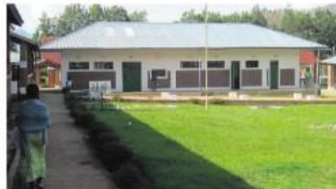
NY FØDEAVDELING: Dette er den nybygde fodeavdelingen drevet av Helse for Congo.