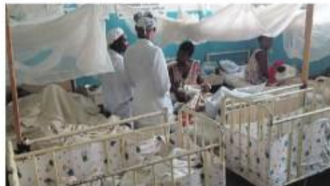
FODESTUE: Her er et bilde fra den gamle fodestuen til prosjektet Helse for Congo. De har nå bygd en ny fodestue.