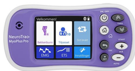
NeuroTrac MyoPlus Pro